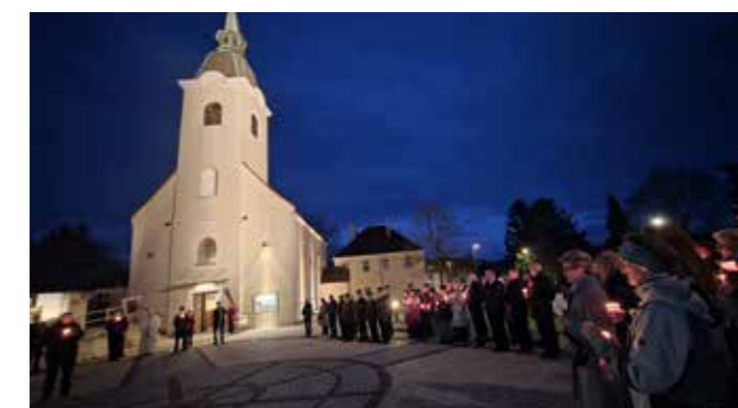
Heiliges Grab & Auferstehung